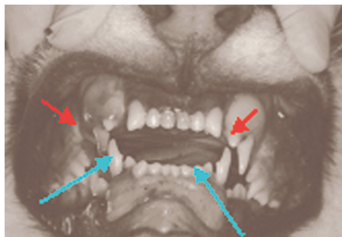
Fig.1. Aspecto da oclusão alterada de um filhote de Puma concolor com 8 meses de idade e retenção dos dentes decíduos. Os dentes caninos superiores estão extruindo do osso alveolar (setas curtas) e os dentes caninos inferiores permanentes apresentam deslocamento no sentido caudal aos dentes incisivos inferiores (setas longas), fazendo com que a sua oclusão seja palatina.

A permanência dos dentes caninos decíduos (Fig.2 e 3a,b) esteve presente em três filhotes de Puma concolor , com 8 meses de idade, comprovadamente irmãos de ninhada.