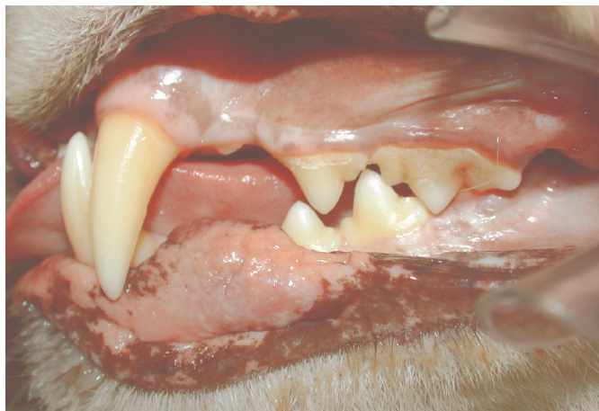
Fig.5. Oclusão rostral normal encontrada em Puma concolor (o mesmo indivíduo da Fig.3), 2 anos e 8 meses após a foto anterior.