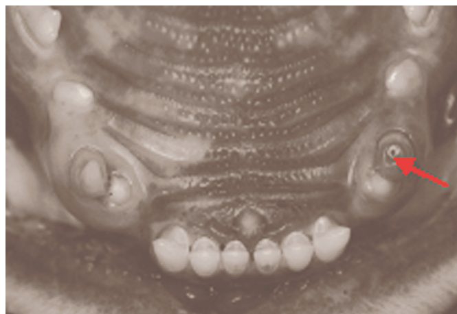
Fig.4. Início da extrusão dos dentes caninos permanentes superiores. Note-se que o dente canino superior esquerdo decíduo apresentou fratura de cúspide com exposição de canal pulpar e escurecimento dental (seta).

Tais achados para Puma concolor não estão descritos em literatura, embora existam relatos de que 5-12% dos mamíferos selvagens apresentam malocclusão, podendo chegar a 40% nos primatas