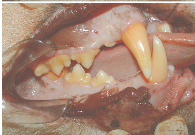
Fig.7. Oclusão lateral direita normal encontrada em Puma concolor , 2 anos e 8 meses após primeiro exame físico.